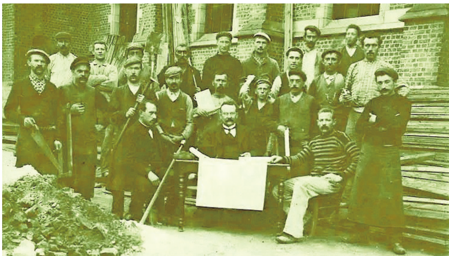
De metsersploeg anno 1904.