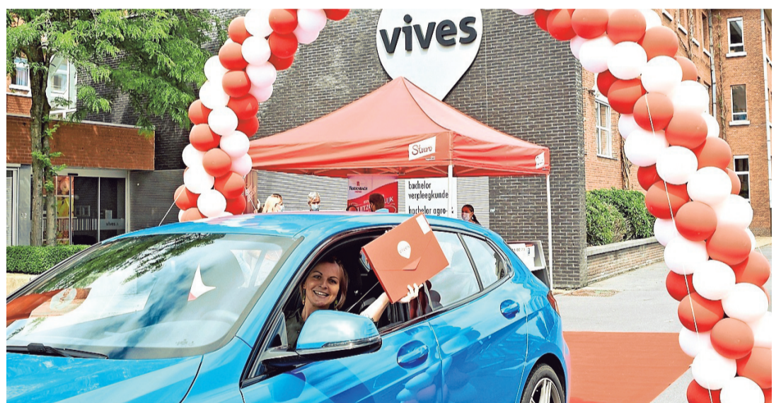
Origineel is het zeker: je diploma ophalen via een drive-in.

De afstuderende studenten van Hogeschool Vives ontvingen hun diploma donderdagmiddag op een originele manier. Op de campus aan de Wilgenstraat werd een drive-insysteem opgezet.